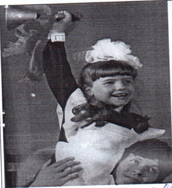
1. право на свободу соборности - для женщины, матери