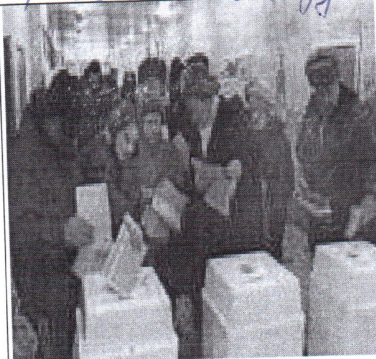
8. право на голос