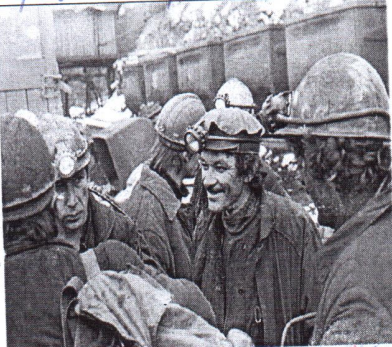
5. право на труд