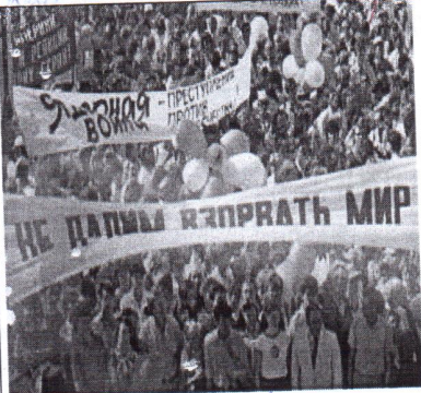
7. право на обращение в государственные органы