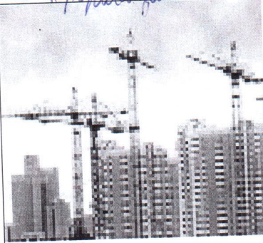
4. право на жилище