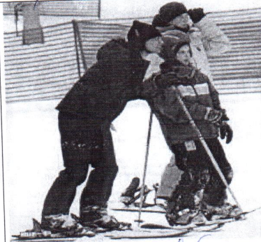
6. право на свободу передвижения