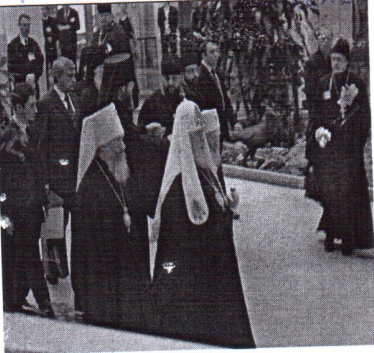
3. право на участие в решении