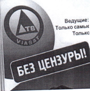
2. право на свободу информации