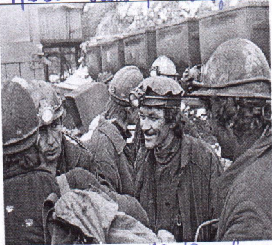
право на свободную работу