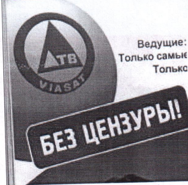
право на свободное выражение