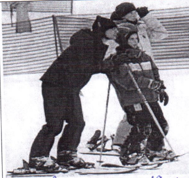
право заниматься спортом