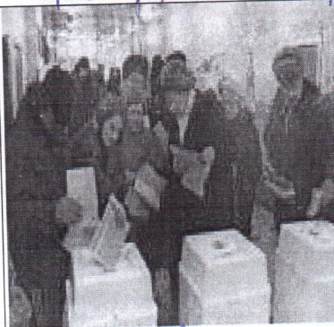
право участвовать в выборах