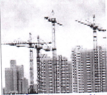
право на строительство