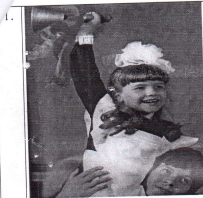
Право на участие