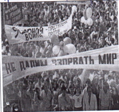
право на свободное выражение